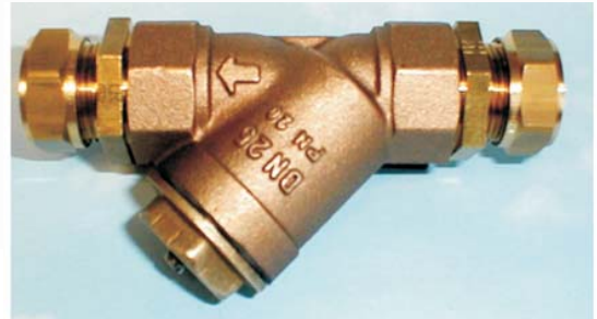
CTN-220, KLÄMRINGSKOPPLING DN 22 - 35