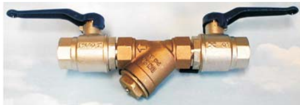
CTN-220V FILTER MED TVÅ VENTILER

CTN-220 är ett magnetiskt filter med sil och är avsett för mindre värme- och kylanläggningar, värmepumpar mm för att "fånga upp" magnetit samt grövre föroreningar. Vid värmepumpar skyddar filtret värmeväxlaren från den isolerande magnetiten och man erhåller en avsevärt längre drifttid med bibehållen effekt. Filtret kan även användas för andra ändamål där såväl sil som magnetisk avskiljare erfordras.