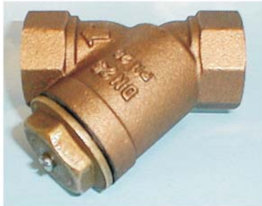
CTN-220, INV GÄNGA DN 20 - 100